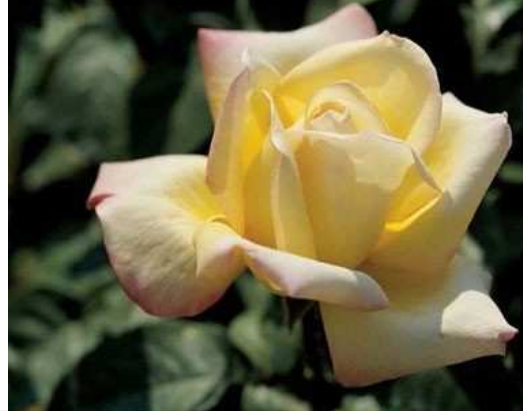
Madame A Meilland®

Floraison de mai à novembre. Grosses fleurs