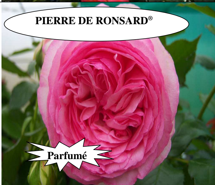
PIERRE DE RONSARD®

Jaune d'or, végétation moyenne 2/3 m petites fleurs