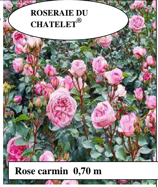
ROSERAIE DU CHATELET®