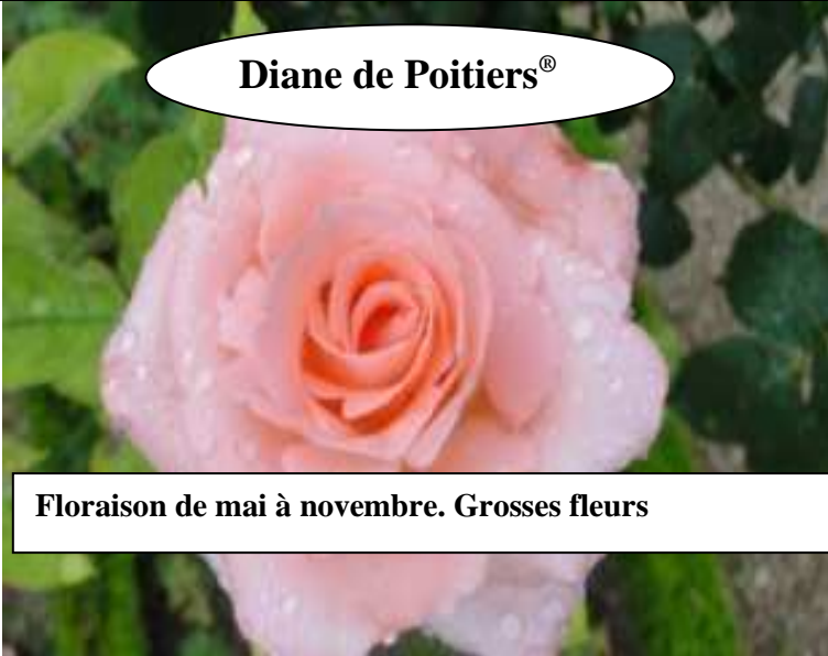
Diane de Poitiers®

Floraison de mai à novembre. Grosses fleurs