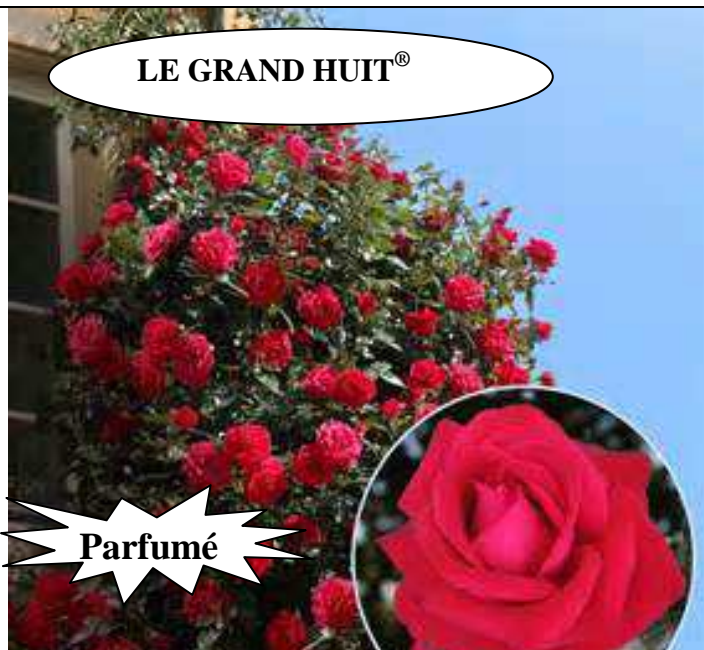
LE GRAND HUIT®

Rose tendre, végétation moyenne, grandes fleurs